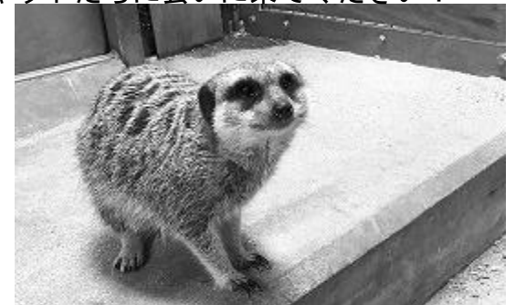
飼育展示係 麻生 未来