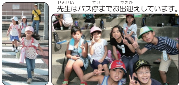
せんせい 先生はバス停までお出迎えしています。